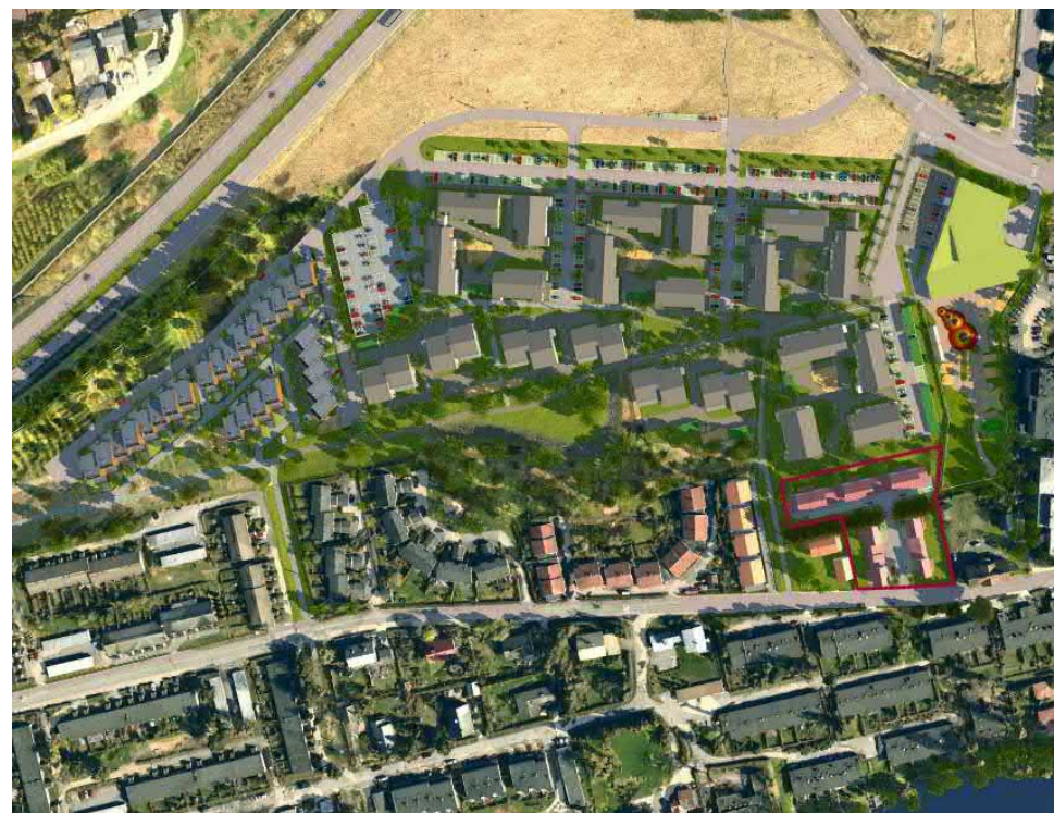
Mallinnuskuva kaava-alueesta, johon pientalojen alue on rajattu punaisella