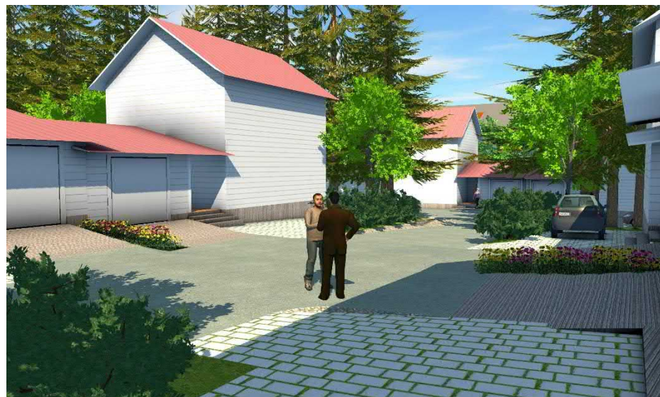
Mallinnuskuva tontin sisääntulopihoista.

Mes-8(1,2 m) Alueen osa, jolle on rakennettava melusuojaksi ympäristöön sopiva meluaita. Suluissa oleva luku osoittaa aidan korkeuden metreissä.