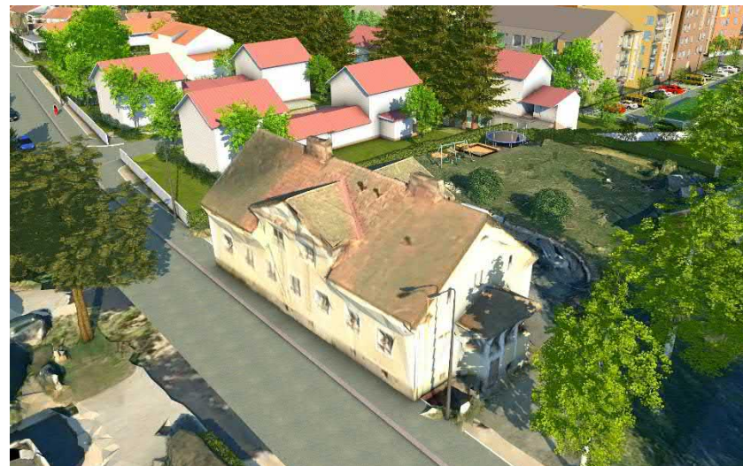
Mallinnuskuva pientaloista kaakon suunnalta katsottuna. Simolan talo on etualalla.

Rakennuksen vesikaton ylimmän kohdan korkeusasema.