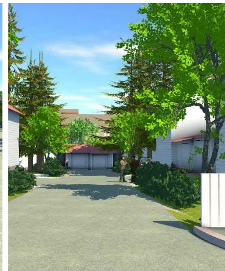
Näkymä Simolankadulta pientalojen ajoväylää pitkin pientaloille.