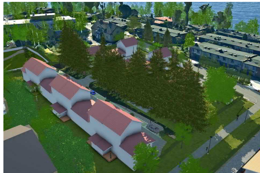
Mallinnuskuva pientaloista luoteen suunnalta katsottuna.