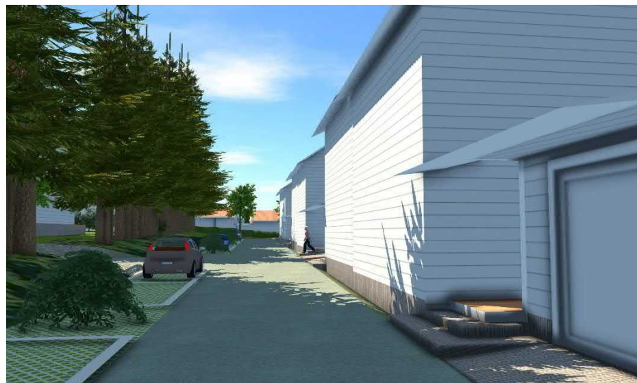
Mallinnuskuva tontin 13 ajoväylää pitkin kohti länttä.

Maanalaista johtoa varten varattu alueen osa.