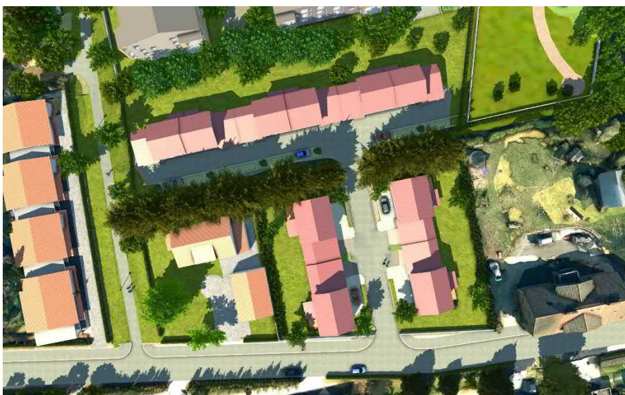
Mallinnuskuva pientaloista ylhäältä katsottuna