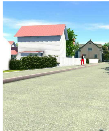
Näkymä Simolankatua itään kohti Simolan taloa.