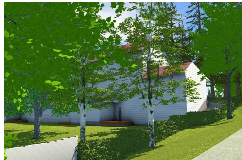
Tontin 13 pientalojen takapihat Sipi Simolan Rinteen pyörätieltä katsottuna.

Esimerkkejä moderneista kaksikerroksisista pientaloista: 1. Lammi-Kivitalo, Lammin Betoni Oy; 2. Arkkitehti Tapani Kankkunen; 3. Arkkitehtitoimisto Merja Eskola; 4. Talora Oy; 5. Kastelli-talot Oy; 6. Arkkitehtitoimisto Merja Eskola