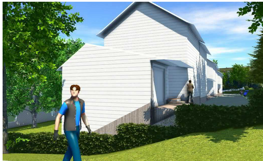
Näkymä Sipi Simolan Rinteen pyörätieltä tontin 13 ajoväylälle kohti itää.